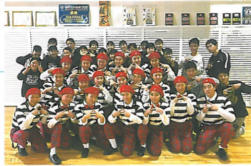
北九州市立高等学校 ダンス部 N9SD CREW (ノースナインスティッツダンスクルー)

1999年に同好会として活動をスタート。 2001年部活動に昇格し、現在まで様々な大会やイベント等で全国区の実績を残している。 2013年北九州市市民文化賞受賞 2016年第4回全国高校ダンス部選手権 全国優勝 2018年GENERATIONS、E-girls サポートダンサーとして活躍