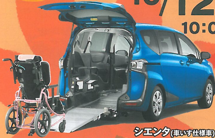
シエンタ(車いす仕様車)