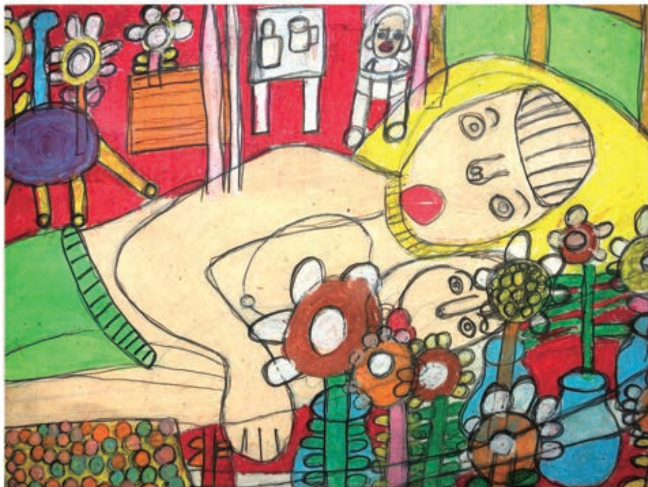
絵:「母と子」高橋孝充 (当日、体育館に展示します)

2023 10.1 (日) inしあわせの村 10:00 ~ 15:00 (中央緑道・芝生広場・体育館)