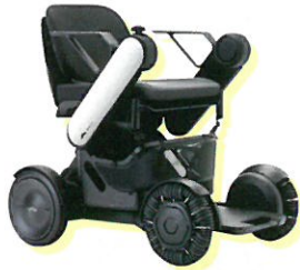
YSE whill model ck