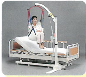
モリトー つるパーシ리즈 Bセット