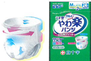
白十字 サルバやお楽パンツ