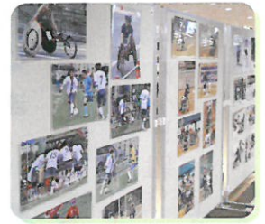
パラスポーツ写真展