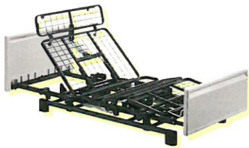
シーホネンズ CORE Neo