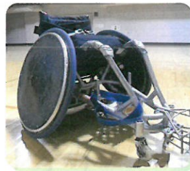
パラスポーツ用具展示