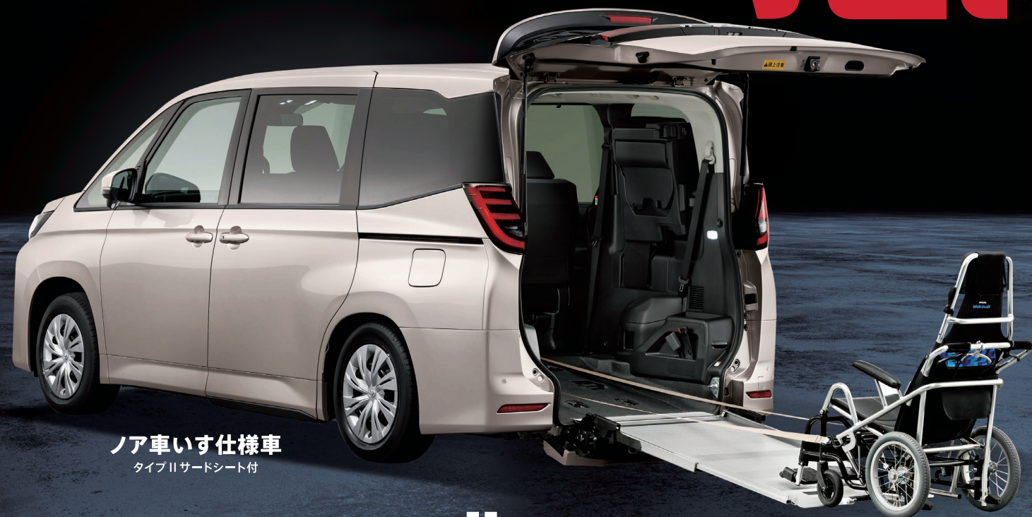
ノア車いす仕様車 タイプIIサードシート付