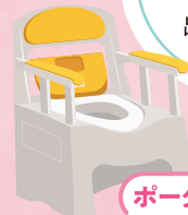
ポータブルトイレ