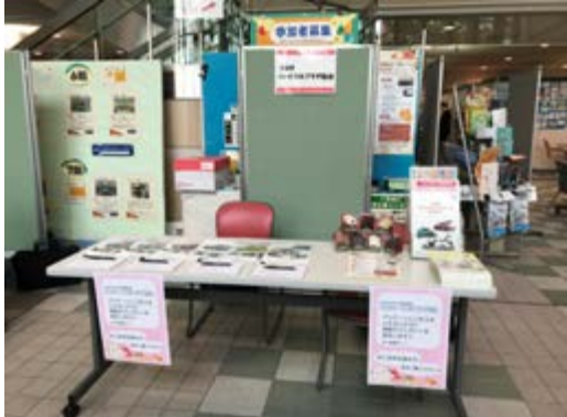
シルバーセンター内 1Fカタログコーナー