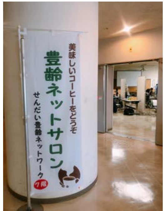
シルバーセンター屋外 展示コーナー