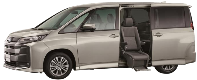
●ノア サイドリフトアップチルトシート装着車