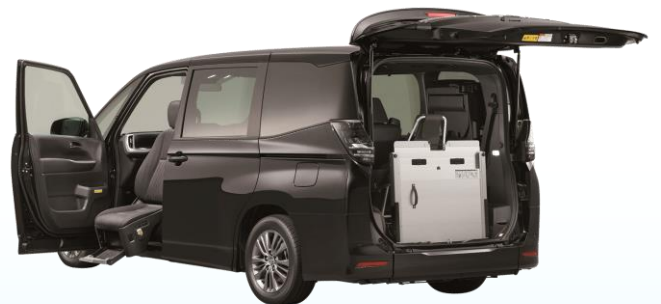
●ヴォクシー 車いす仕様車タイプII サードシート付+助手席リフトアップチルトシート