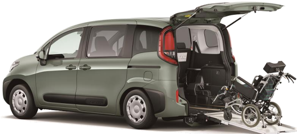
●シエンタ 車いす仕様車 タイプI