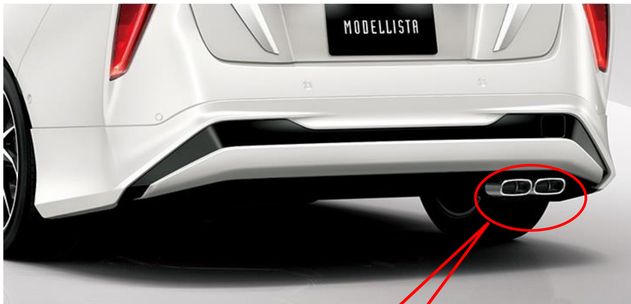
マフラーカッター