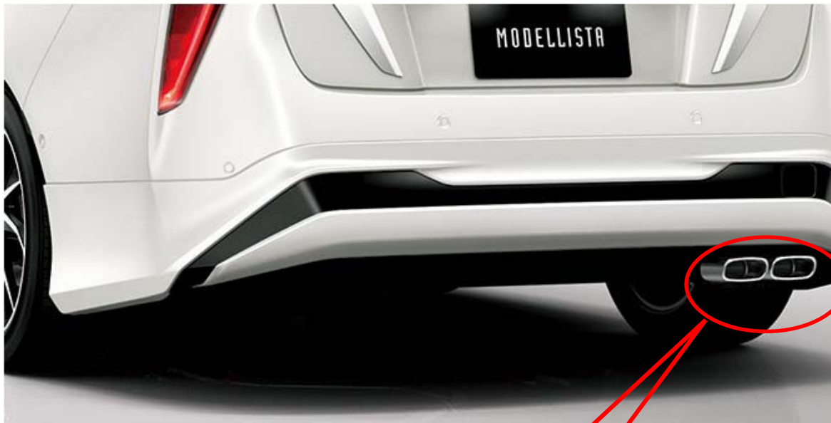
マフラーカッター