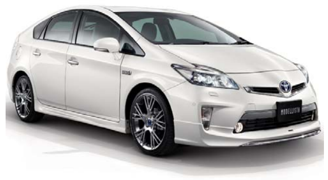
MODELLISTA Ver 3