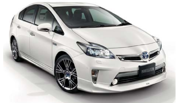
MODELLISTA Ver 1