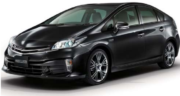
AERO TOURER KIT