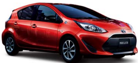
アクア “Rirvie” 外観イメージ

「笑顔にあふれた人生」を意味し、自然体で自分らしく生きる女性の姿を連想させた名称。