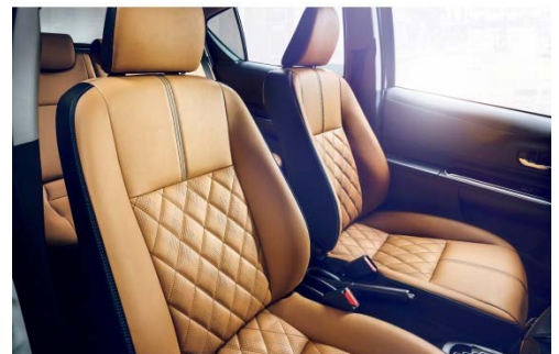
アクア “Rirvie” 内装（シート）イメージ