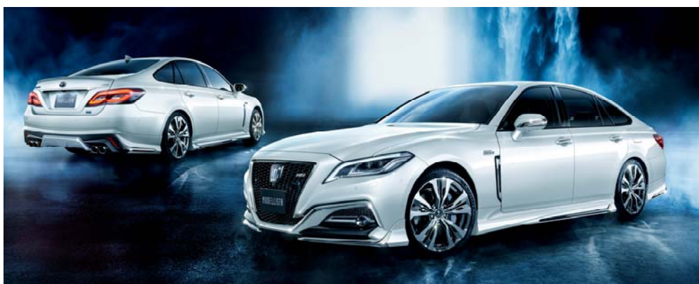
MODELLISTA for RS ボディ

また、上質でスポーティなフロントフェイスを演出する「フォグベゼルガーニッシュ」と、「ミラーガーニッシュ」、新しく縦型デザインを取り入れた「フェンダーガーニッシュ」の3点を「クールシャインキット」として設定。足元のドレスアップには「19 インチアルミホイール&タイヤセット」を設定した。