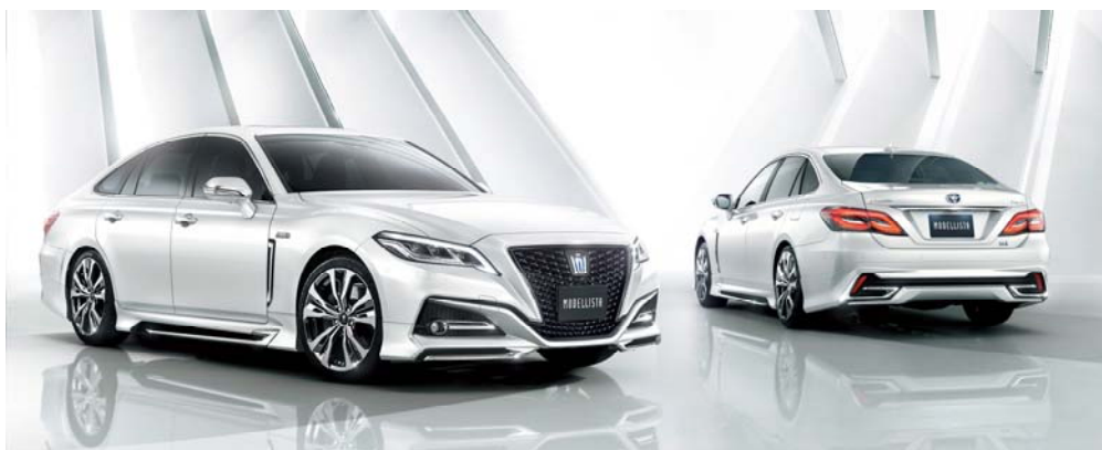
MODELLISTA for G/S/B ボディ