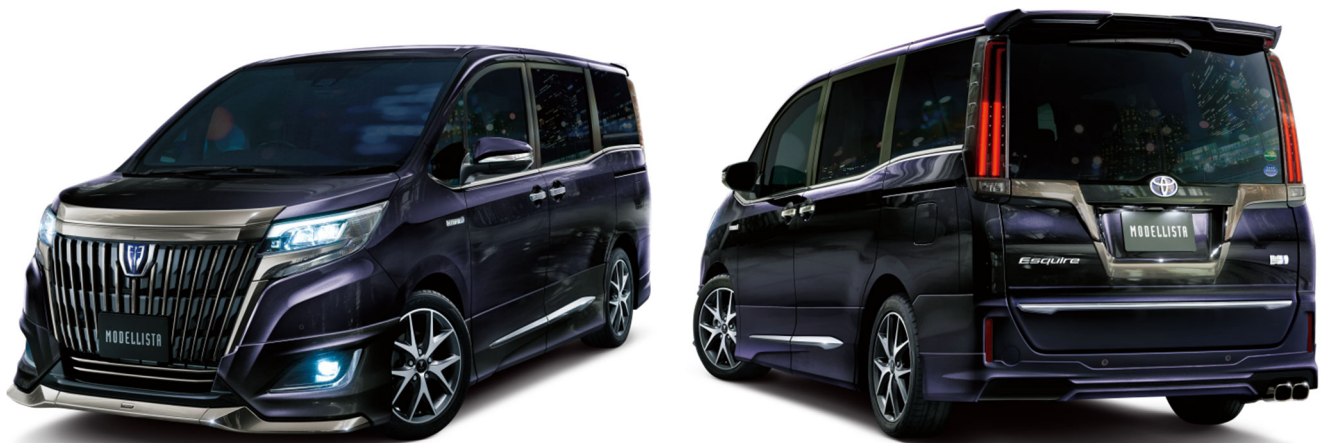
MODELLISTA For HYBRID Gi “Premium Package・Black-Tailored”（特別仕様車）